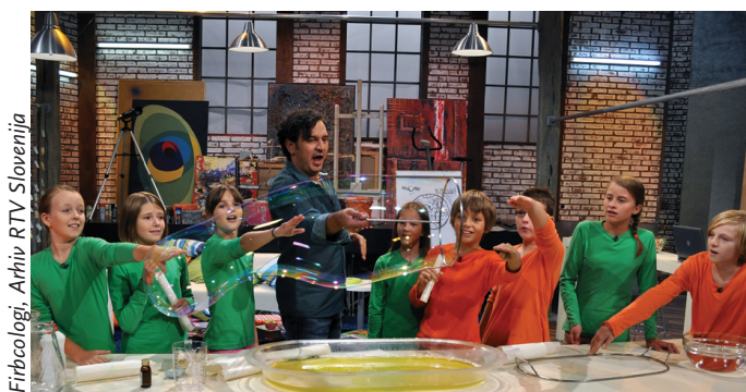
Fircologi, Arhiv RTV Slovenija

Starejši šolarji so trši oreh, ko razmišljamo o tem, kako jih učinkovito nagovarjati s pomočjo televizijske oddaje. Oddaja, v kateri nastopajo njihovi vrstniki, je zagotovo ena izmed možnosti. Mladi gledalci budno spremljajo in komentirajo vse: vedenje mladih voditeljev, njihov govor, čustva, odnose, duhovite prebliske, oblačila, pričeske. V pogovoru z njimi se nam razkrije njihov pogled na svet in življenje. In prav to vam bomo predstavili z ogledom oddaje s šolarji in vodenim pogovorom, ki mu bo sledil.