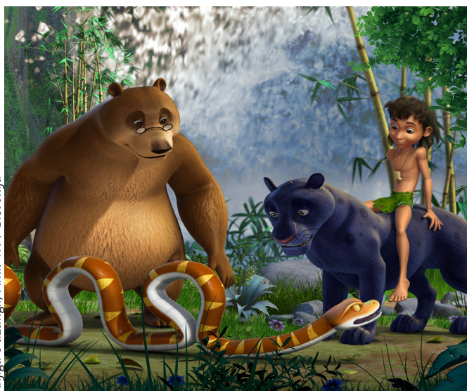
Knjiga o džungli

Medijsko opismenjevanje otrok se začne že v zgodnjem otroštvu in žanr, ki je otrokom najbližji, so zagotovo risanke. Toda – ali so res vse risanke primerne za otroke? Na kaj moramo biti še posebej pozorni, ko se odločamo, katere risanke otroku ponuditi v njegovih prvih srečanjih z mediji? In kakšen pomen ima za otrokov razvoj kakovostna sinhronizacija v slovenski jezik? Na predavanju boste dobili odgovore na ta in še veliko drugih pomembnih vprašanj, povezanih z risankami za otroke.