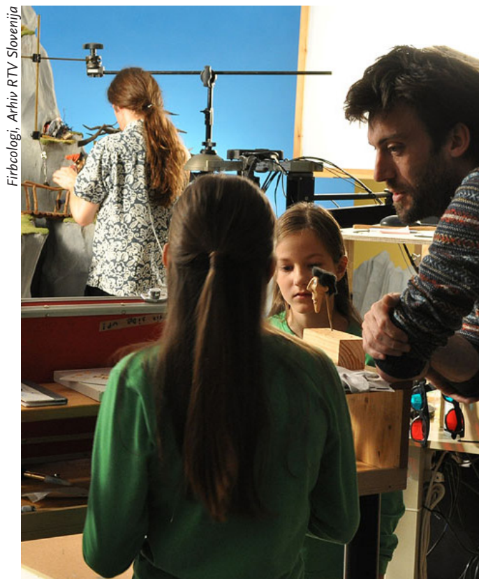
Firbcologi, Arhiv RTV Slovenija

Predstavitve bo potekala po protokolu kratkega diskurza skozi zgodovino robotske umetnosti pri nas in se nato osredotočila na konkretno razstavo ARTROBOLAB , ki je bila decembra 2013 v Kulturnem središču vesoljskih tehnologij (KSEVT) v Vitanju.