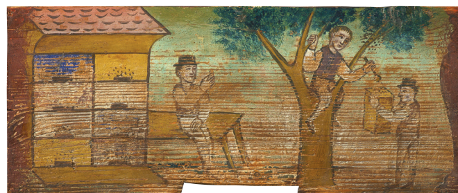
Poslikana panjska končnica, Čebelarški muzej v Radovljici

In če morda še niste vedeli za mednarodno uspešnost našega medu – slovenski med je 19. slovenski proizvod, registriran pri Evropski komisiji.