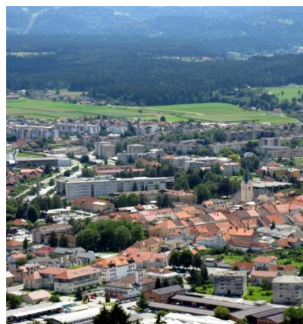
Slika 7: Mesto