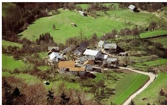
Slika 2: Naselje