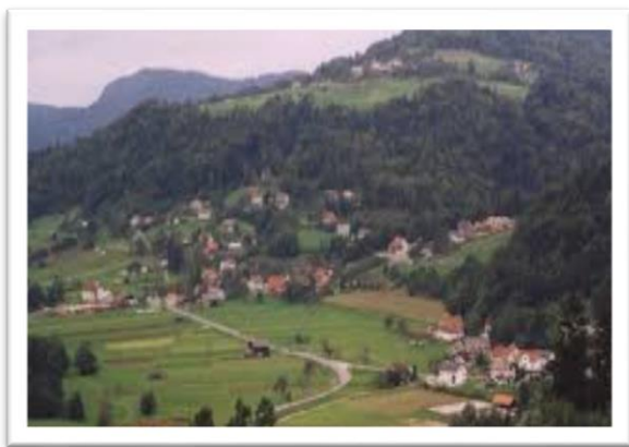
Slika 5: Naselje